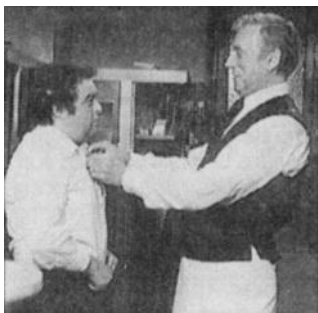
Jacques Villeret, Yves Montand