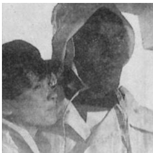
Sabine Azéma, Isaach de Bankolé