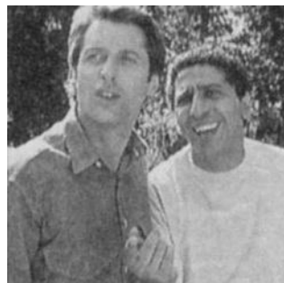
Antoine de Caunes, Smaïn