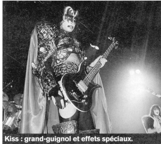
Kiss : grand-guignol et effets spéciaux.

confirment d'ailleurs leur talent de compositeurs et de musiciens. En businessmen habiles, ce sont surtout les titres de cette époque qu'ils joueront sur scène, au milieu de leurs habituels délires scéniques de feu, de sang et d'effets spéciaux.